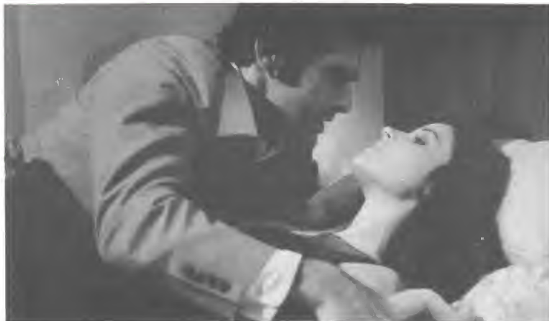
Andrés García - Amparo Muñoz

PRODUCTORAS: Midega Film, S.A.- Núñez de Balboa, 50. Madrid-1. Cinematográfica Filmex.- Méjico. ARGUMENTO Y GUIÓN: Jesús Rodríguez y Luis María Delgado. DIRECTOR: Luis María Delgado. FOTOGRAFIA: Daniel López Santos. MUSICA: Gustavo C. Carrión. MONTAJE: Rafael Ceballos. INTERPRETES: Andrés García, Amparo Muñoz, Helga Liné, Jorge Russek, Christa Linder, Grace Renat, Angélica Chain, Anais de Melo. Eastmancolor-Panorámica-Duración: 1 h. 28 m. Distribuidora nacional: Manuel Salvador, S.A.- Gran Vía, 62, 8º. Madrid-13. Venta mundial: Midega Film, S.A.- Núñez de Balboa, 50. Madrid-1. Cinematográfica Filmex, S.A.- Atletas, 2, Col. Churubusco.- Méjico 21, D.F.